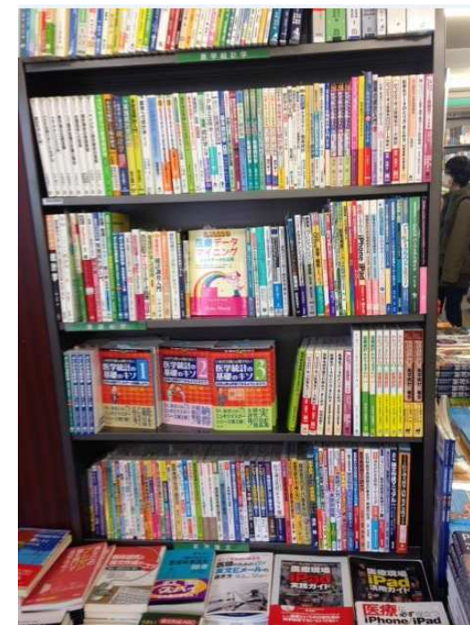
三省堂書店:神保町本店